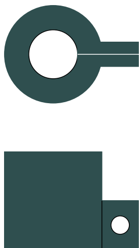
図 2: 止め具

止め具は以下のように円筒形をしており、直径 6mm の穴がネジで締まるように隙間を施してあります。